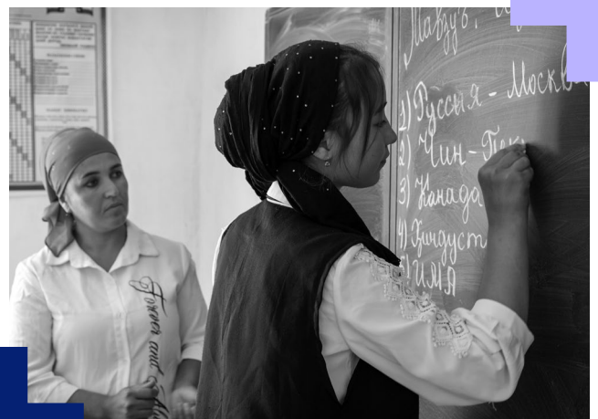
Una estudiante y su profesora frente a una pizarra en la Escuela N° 30 de Dangara, Tayikistán.